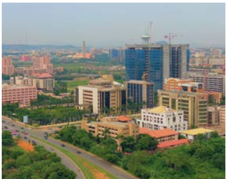
Abuja, Wuse District. La chapelle actuelle est à la périphérie de ce District ▲

Dans ce contexte particulièrement difficile, les fidèles qui viennent chaque dimanche à la chapelle sont contraints à de nombreux sacrifices. Parcourant des distances importantes pour se rendre à la messe ou au catéchisme, ils se retrouvent chaque semaine dans une pièce très étroite, mal ventilée, à l'aspect plutôt peu engageant, située dans une propriété privée totalement anonyme et dépourvue de toute sécurité, qui découragerait le premier visiteur venu. Il convient à cet égard de saluer la générosité des fidèles dont certains mettent beaucoup d'énergie et le peu d'argent qu'ils ont pour en faire un lieu digne du Saint Sacrifice de