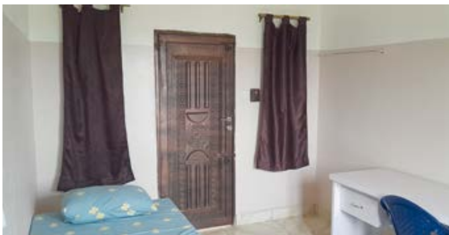
▲ Une chambre de préséminaristes