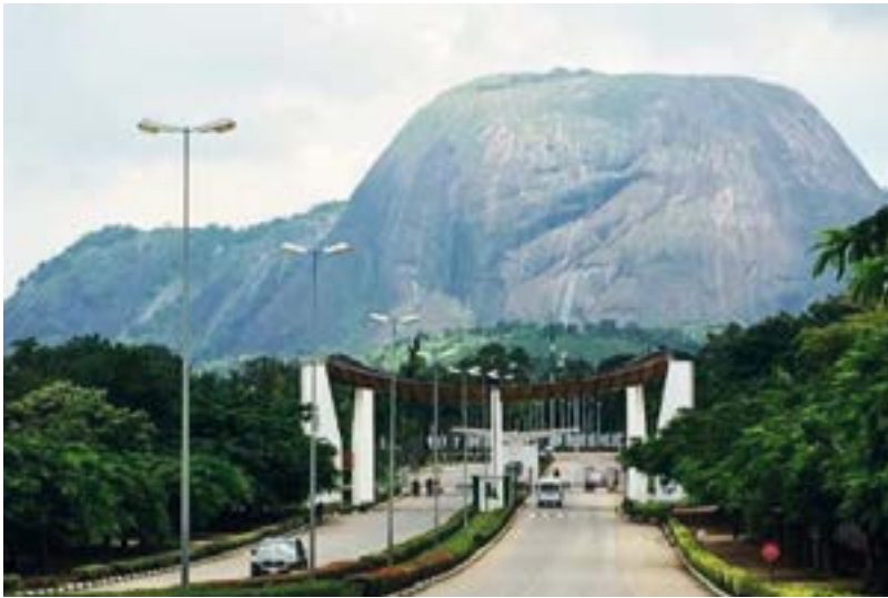
L'entrée de Aso Rock Presidential Villa, le siège de l'exécutif nigérian ▲