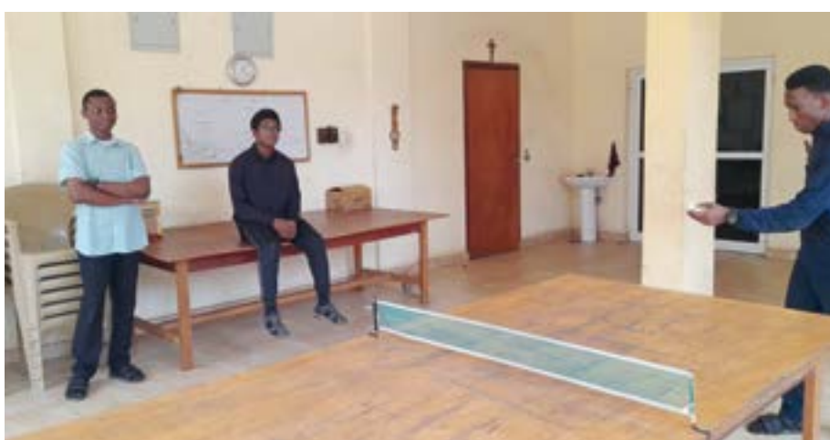
▲ Récréation. La plupart des récréations ont lieu au Prieuré. Le quartier n'est ni propre aux promenades, ni très sûr