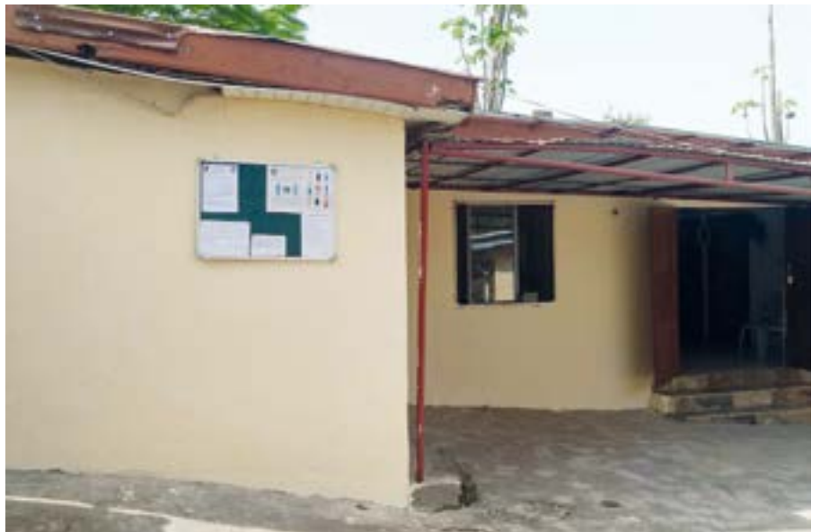
Et notre chapelle... ▲

La chapelle actuelle est un ancien atelier réaménagé.