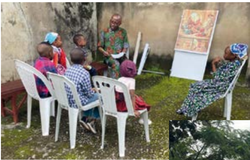
Catéchisme de préparation à la première communion. ▲