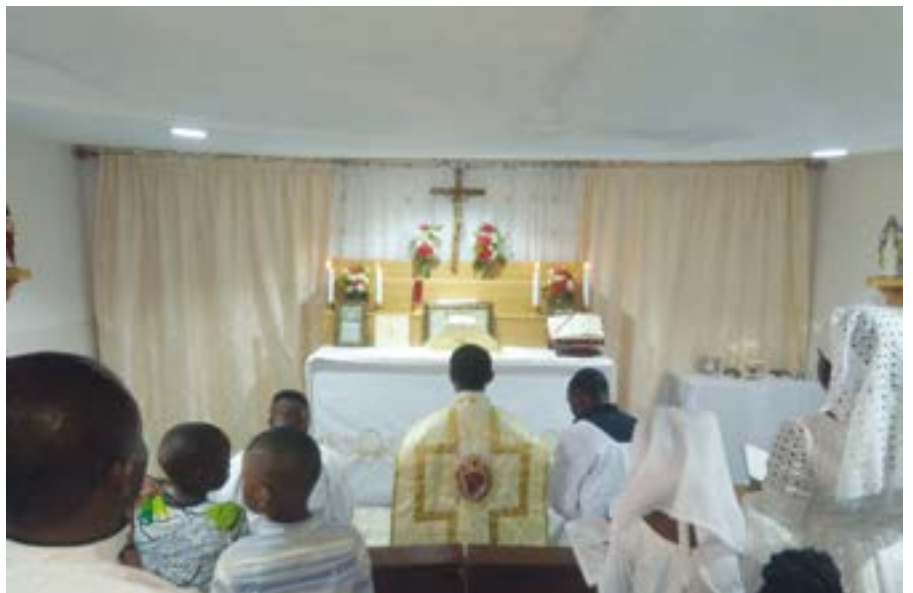
L'intérieur de la Chapelle accueille difficilement 60 personnes; ▲ la communauté attend 120 fidèles certains dimanches