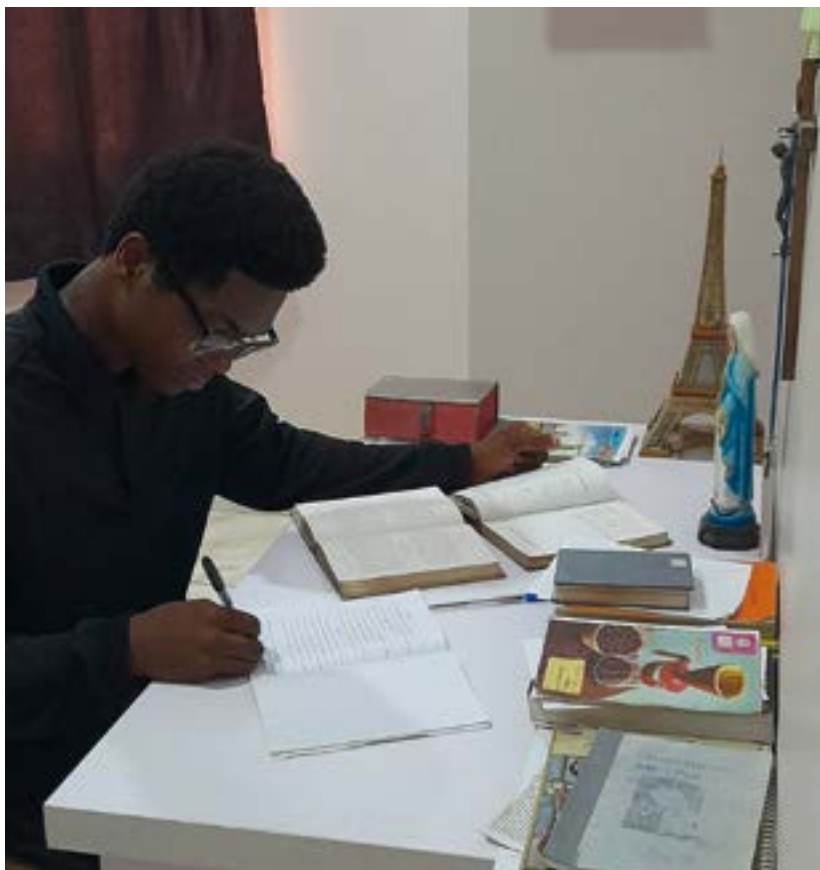
Étude personnelle en chambre

et deviennent ingénieurs ou hommes d'affaires.