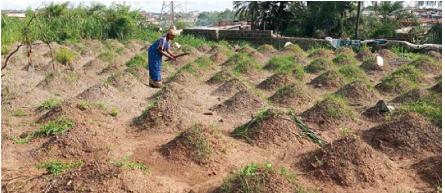
▲ Une plantation de manioc. Le terrain nu du Prieuré a maintenant été complètement parcellé en petits jardins. C'est une très grande aide pour certaines familles.