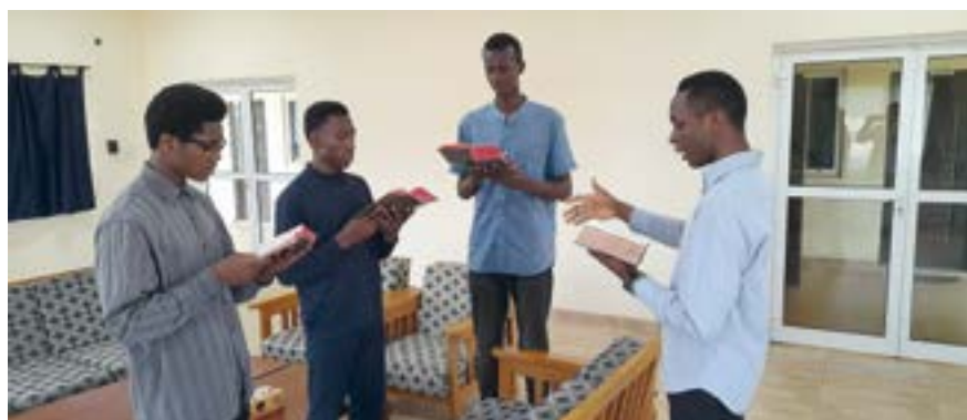
▼ Répétition de Grégorien. Les préséminaristes chantent (bien) en moyenne deux messes par semaines