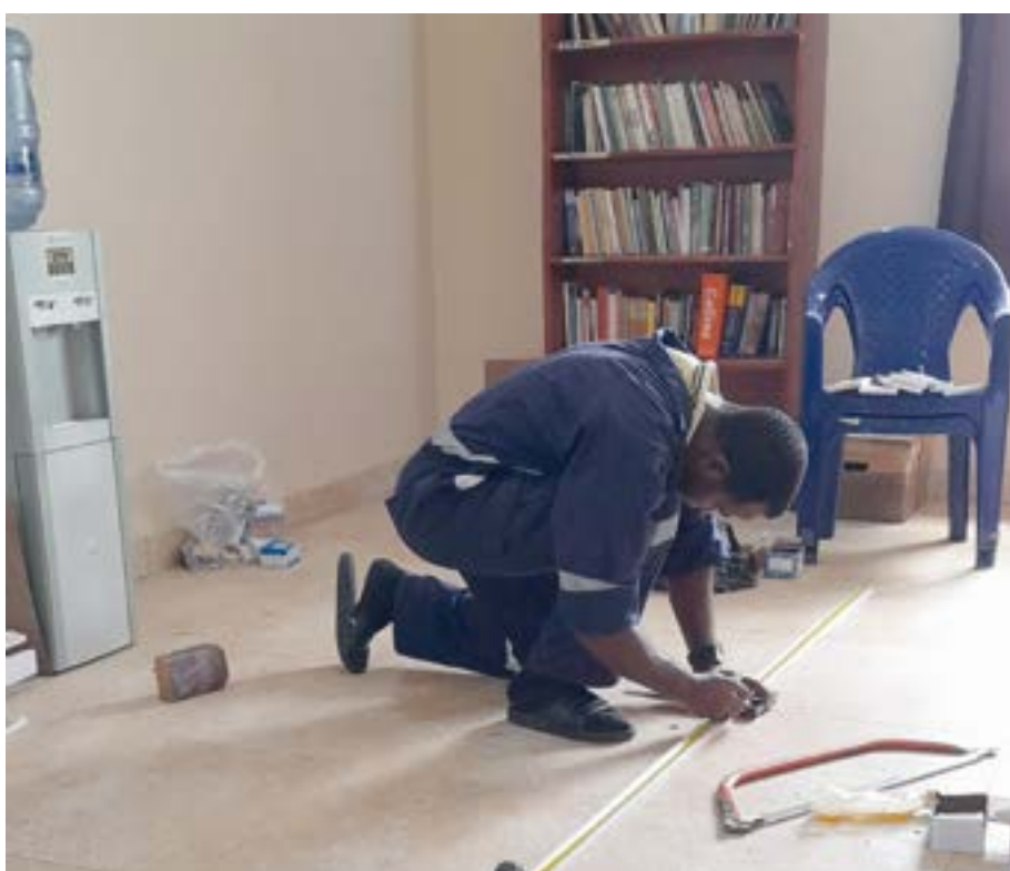
▲ Travaux de menuiserie. Ici l'assemblage de bureaux pour les chambres des préséminaristes

jamais me mettre en colère. Ainsi, grâce à ma mère, je pus éradiquer ce vilain défaut. Aujourd'hui, je ne me souviens même plus de la dernière fois où je me suis mis en colère.