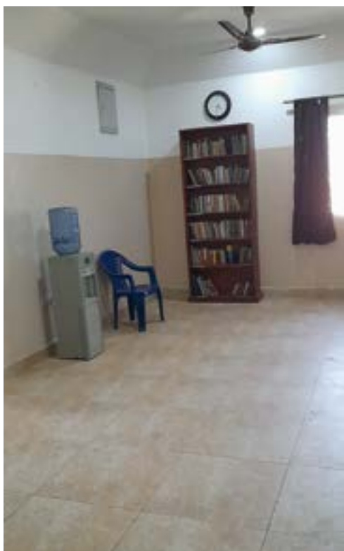
▲ Le "lobby" de l'étage des préséminaristes. D'autres bibliothèques fabriquées dans notre atelier viendront meubler les murs. Le plus dur sera de les remplir de livres (en anglais). Le frêt depuis les États-Unis ou le Royaume-Uni rend le prix des livres absolument prohibitif

des servants de Messe de ma Paroisse. Je me mis alors à leur parler de la Tradition ! Mais ils étaient tellement attachés à leurs habitudes qu'ils ne voulurent même pas considérer mon invitation d'assister à la Messe traditionnelle. Trois d'entre eux vinrent mais se plainquirent de l'utilisation du latin et de la distance qu'ils devaient parcourir pour se rendre à l'église. Ils commencèrent rapidement à me reprocher mes absences à la Paroisse et mon refus de servir la Messe avec eux si bien que j'abandonnai ma fonction de vice-président et que je me concentrai sur la Croisade du Rosaire. Plus tard, je rejoignis les servants de Messe et la chorale de la chapelle Saint Pie X. J'avais prévu d'obtenir mon WAEC [baccalauréat général] avant de confier mon désir de vocation au curé mais je n'ai pas pu passer l'examen à cause de la pandémie. Je m'entretins alors avec l'abbé Peter Scott, prêtre à la Fraternité Saint Pie X, qui me confirma l'importance du WAEC et me conseilla de lire des livres spirituels tels que L'histoire d'une âme, Le combat spirituel, etc. J'ai continué à servir la messe tout en me préparant au WAEC que j'obtins en novembre 2021.