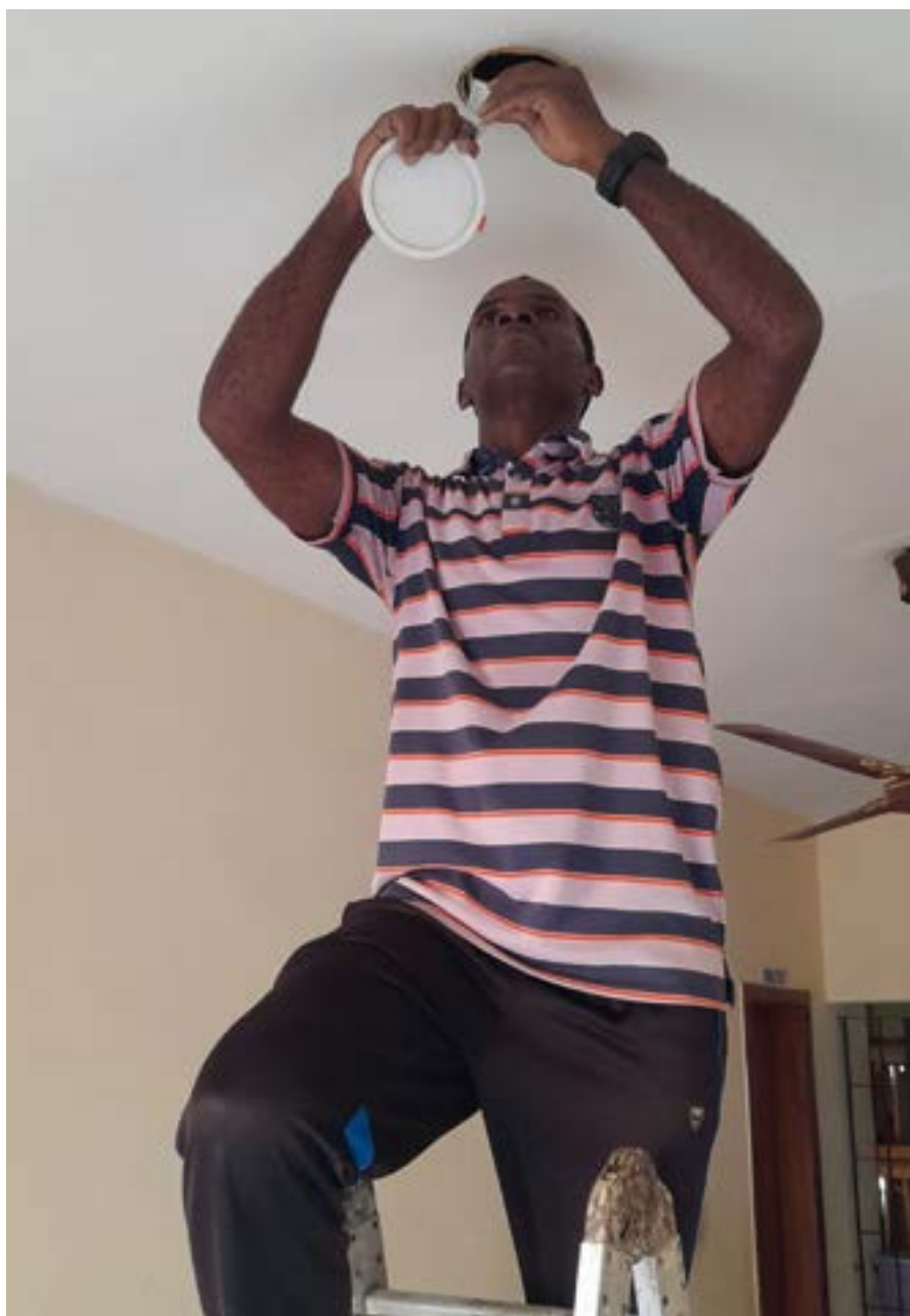
De petits travaux de maintenance de la maison font partie du quotidien des préséminaristes

Depuis mon enfance, j'ai le désir d'être Prêtre. À l'âge de cinq ans, j'ai rejoint la Croisade du Rosaire où j'apprends de nombreuses prières. Je me suis rapidement intéressé à l'histoire des trois enfants de Fatima et c'est ainsi que ma vie spirituelle a commencé. J'ai essayé d'orienter ma vie en suivant la devise de la Croisade du Rosaire : « Prière, Pénitence et Sacrifice ». Petit à petit, je sentis grandir en moi l'amour de Dieu et le désir de faire des sacrifices et des pénitences pour la conversion des pécheurs et pour apaiser Dieu tant offensé. La troisième apparition de Notre-Dame de Fatima m'a profondément marqué : les trois enfants ont vu l'enfer, l'endroit où vont les pauvres pécheurs parce que trop peu de gens prient et se sacrifient pour eux. Dès lors, j'ai fait de la conversion des pécheurs ma première intention de prière pour sauver les âmes de