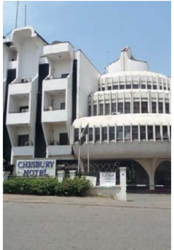
A villes nouvelles, certaines hardiesses architecturales ▲